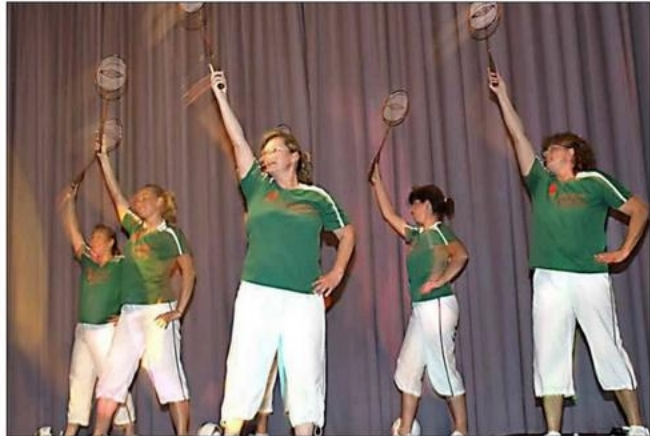
Das Show- und Tanzballett stellte die Sportmöglichkeiten im Verein vor.