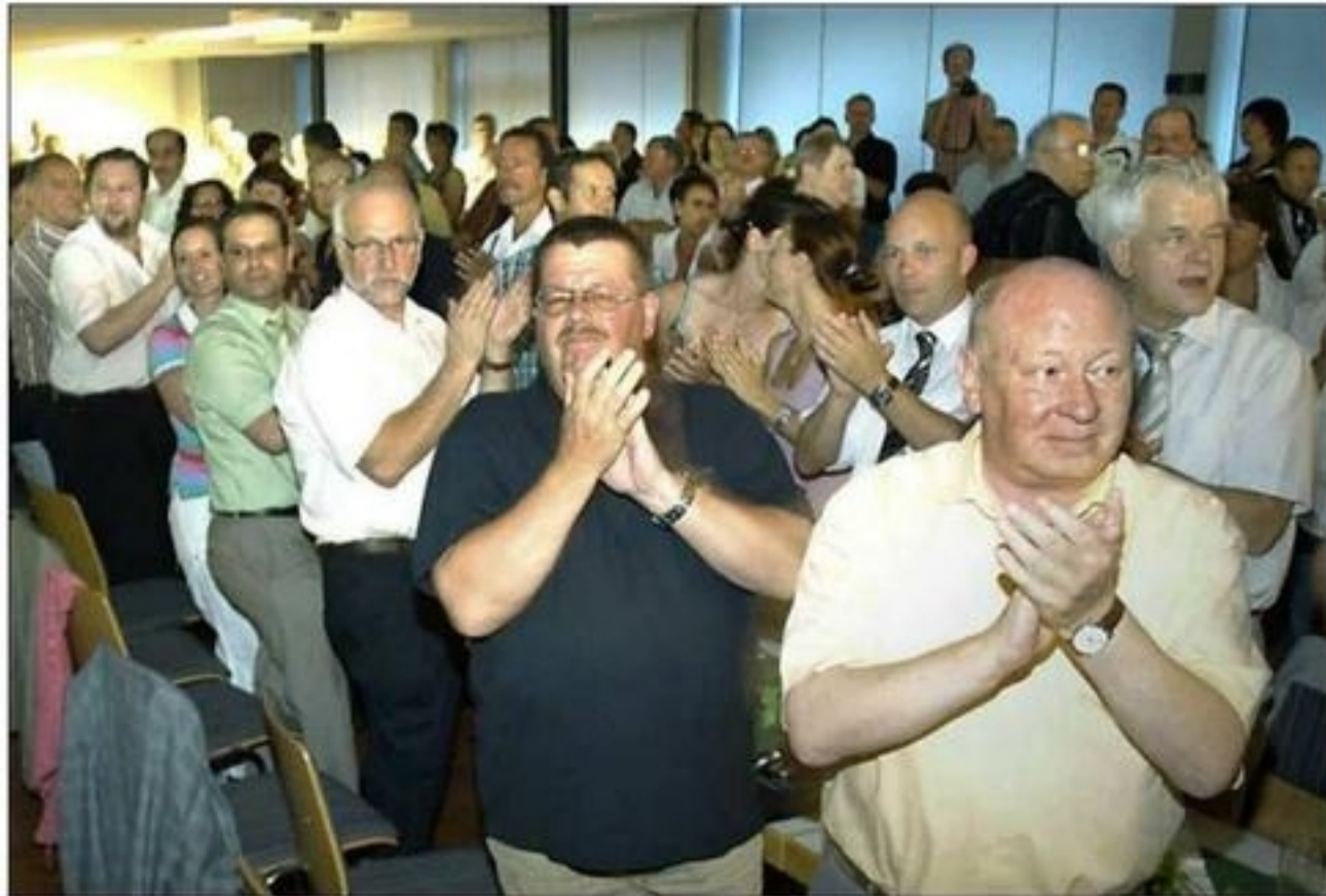
Viel Applaus gab es im Bürgerhaus für den Jubilar von den zahlreichen Gästen.