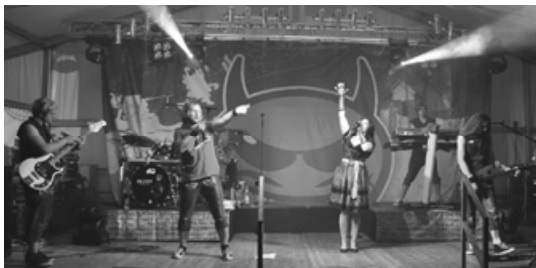
Wiedersehen im nächsten Jahr mit den Partyteufeln