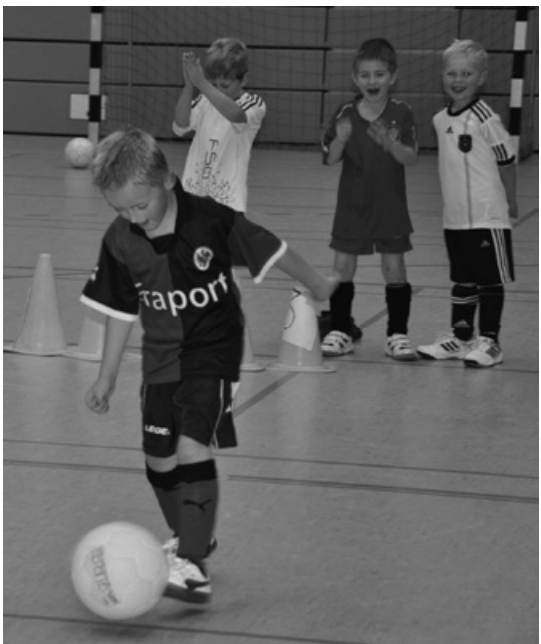
Ballübungen werden begeistert beklatscht