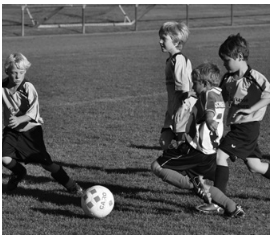
Unser Nachwuchs läuft und läuft und .....