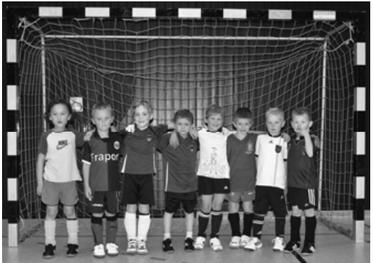
das Team der G-Jugend – eifrig bei der Sache

In den nächsten Ausgaben stellen wir an dieser Stelle die Jugend-Teams im Einzelsteckbrief vor.